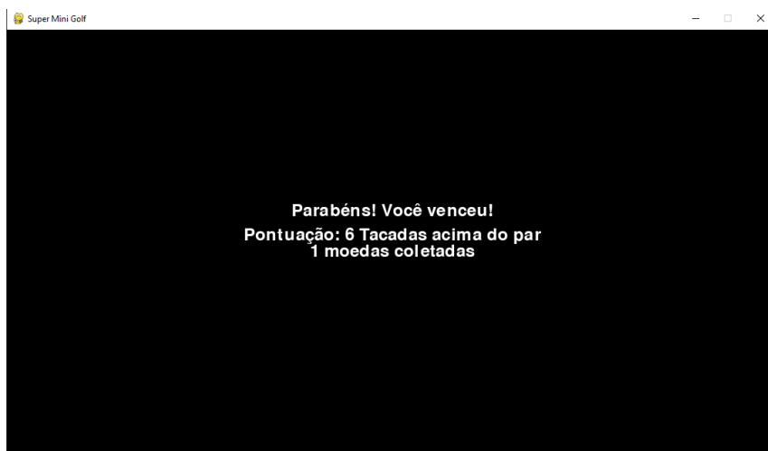
Figura 3. Tela de finalização.

O desenvolvimento deste jogo de golf 2D representou uma oportunidade valiosa para o aprofundamento em programação e física de jogos, além de familiarização com a biblioteca Pygame . O projeto não só contribuiu para o crescimento pessoal dos envolvidos, ensinando-os a estruturar um código mais organizado, como também aprimorou habilidades em resolução de problemas e design de mecânicas de jogo. A experiência foi enriquecedora, e a criação deste jogo evidenciou a importância de uma metodologia de desenvolvimento bem organizada, permitindo que cada etapa fosse concluída com eficiência e resultado satisfatório.